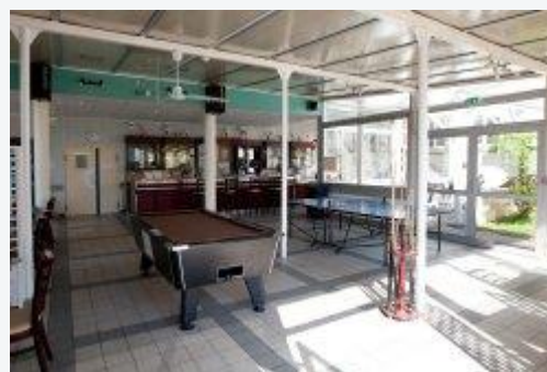
Lieu de vie et atelier Espace FERRANT

L'accès à la connexion WIFI est possible dans le lieu de vie. Un code WIFI individuel vous sera fourni à l'accueil sur votre demande.