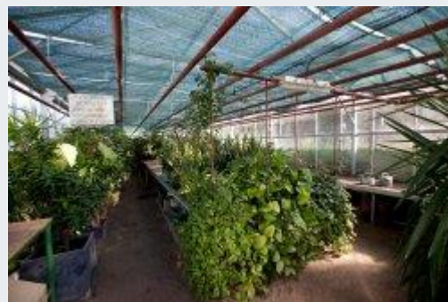
La serre de l'atelier Espaces Verts

L'atelier est un lieu d'écoute, d'échanges, d'accompagnement dont les encadrants sont les référents éducatifs. Il réadapte à une vie sociale. La participation à un atelier favorise la récupération physique et cognitive. Au travers des activités proposées, l'atelier restructure et amène progressivement le patient à une revalorisation, une autonomie, une responsabilisation en développant l'estime de soi.