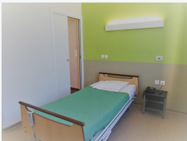
Illustration d'une chambre simple

Si vous avez souscrit un contrat auprès d'une mutuelle complémentaire (ou d'une assurance complémentaire santé), il est possible que celle-ci prenne en charge ces frais. Si le contrat que vous avez souscrit le permet, le Centre Hospitalier facturera alors directement le supplément à votre mutuelle, sans avance de frais de votre part.