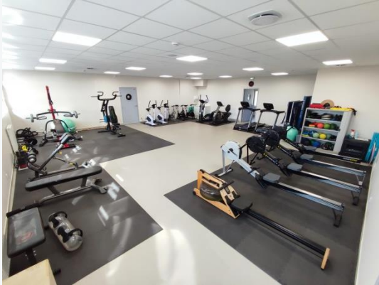
La salle de sport

Les activités thérapeutiques sportives, culturelles, loisirs et de soins :